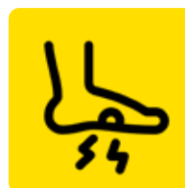
Lesiones en los pies