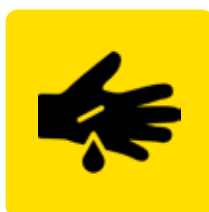
Corte en Mano / Dedos